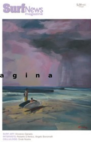
SURF ART Vincenzo Canale ACRILICO SU LEGNO 83x110 cm DELL'ARTISTA: Roberto D'Amico, Angelo Bonanni DELL'EDIZIONE: Onle Noire

Inserito il 08 dicembre 2010 alle 23:27:00 da XaccaSurf . IT - Surfnews Indirizzo sito : Surfnews